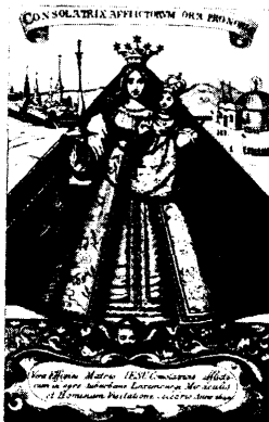
DAS GNADENBILD VON KEVELAER